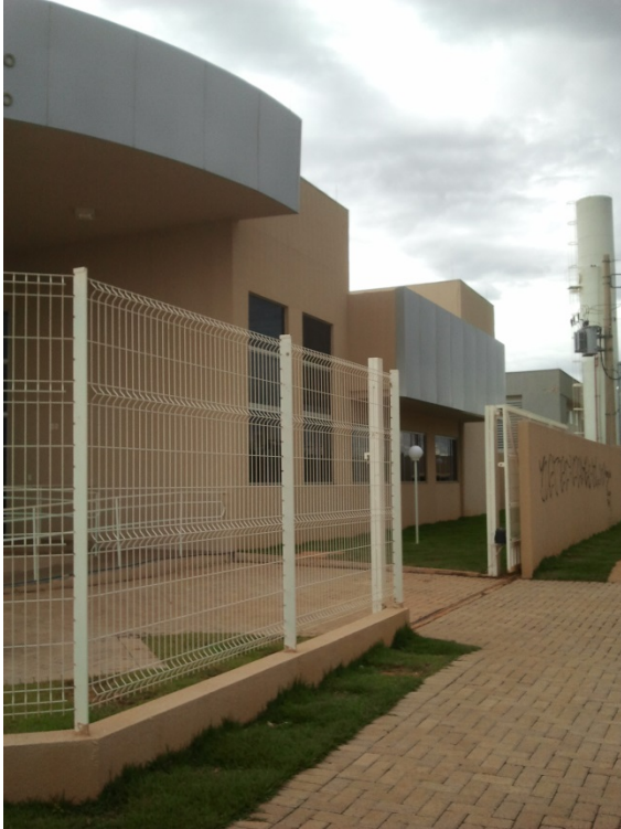
Acesso à Vara do Trabalho