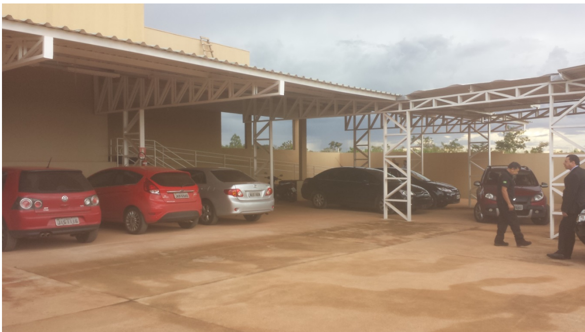
Estacionamento da Vara do Trabalho