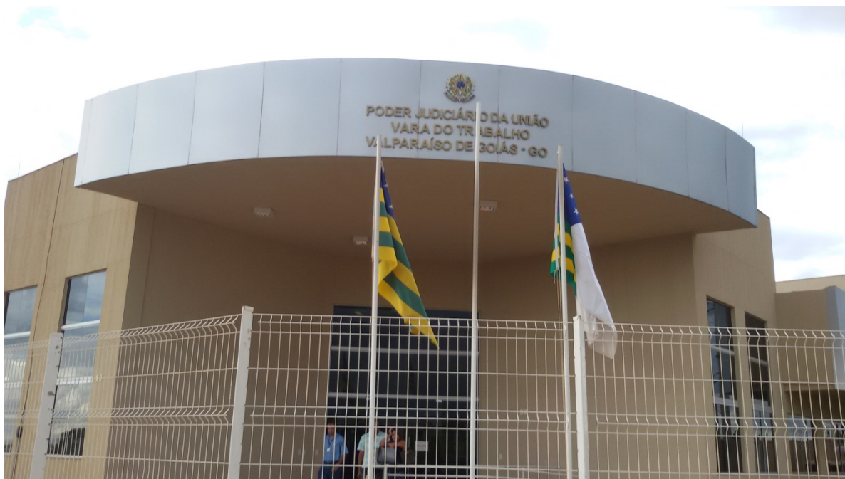
Fachada da Vara do Trabalho de Valparaíso (GO)