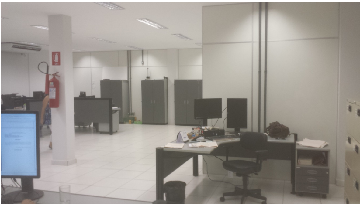
Secretaria da Vara do Trabalho