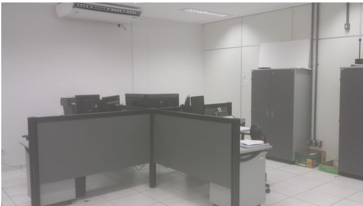
Estação de Trabalho

Conselho Superior da Justiça do Trabalho Coordenadoria de Controle e Auditoria Setor de Administração Federal Sul (SAFS), Quadra 8, Lote 1, Bloco A, sala 436 / Brasília – DF / CEP 70.070-600 Telefone: (61) 3043-3123/ Correo eletrônico: ccaud@csjt.jus.br