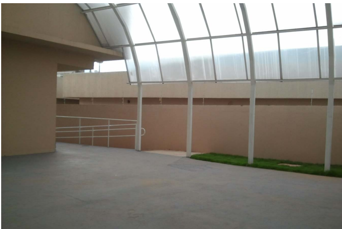
Área destinada à convivência dos servidores e terceirizados